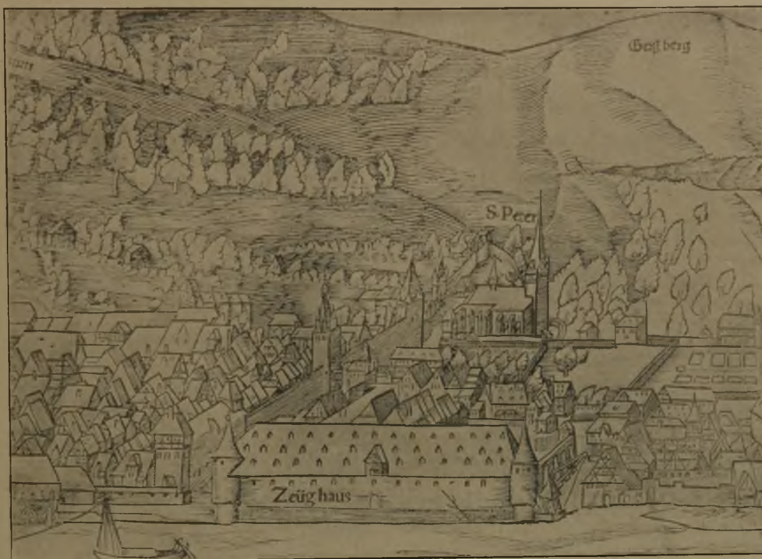
Abbildung 3. Ausschnitt aus Sebastian Münsters Kosmographie (um 1550).

und das hohe mächtige Dachwerk, der Giebelaufbau an der Neckarseite und der an das Gebäude anschließende große Hof sind nur verständlich, wenn zugleich Getreide, Lebensmittel und allerhand sonstige Vorräte