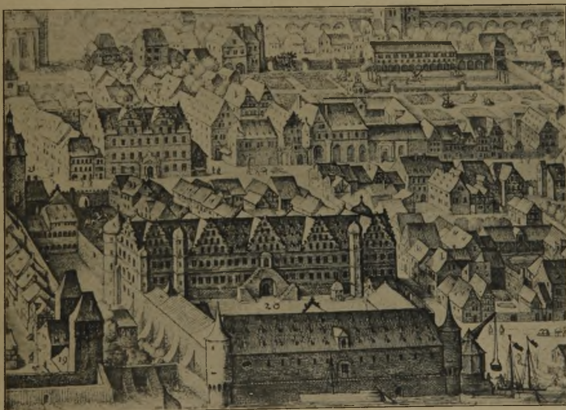
Abbildung 4. Ausschnitt aus dem Merianschen Stich von 1620.

die Außenseiten der Bauanlage mit Waffen bestrichen werden konnten. In dem Gebäude selbst wurden, wie schon der auf einem Stich aus dem Jahr 1550 zum erstenmal vorkommende Name sagt, die für den Kriegsfall nötigen Waffen untergebracht (Abbildung 3). Die Lage des Zeughauses unmittelbar am Neckar