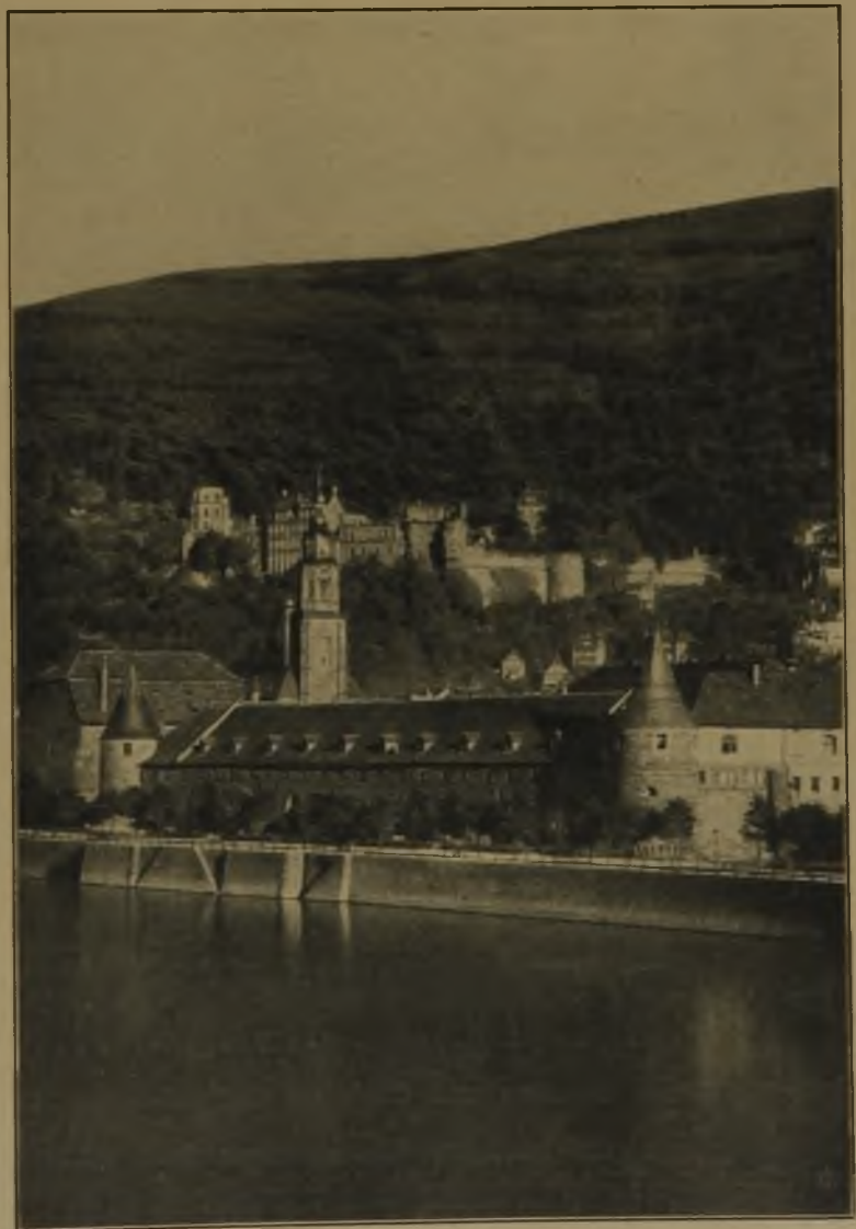
Abb. 5. Ansicht des Zeughauses vom Neckar.

der Bedürfnisse das mächtige Gebäude zu verwerten, das bisher, in der besten Lage der Stadt, vornehmlich dazu gedient hatte, Lebensmittel, Tabak, einige Zeit auch Buchenlaub, als Lagerhaus aufzunehmen.