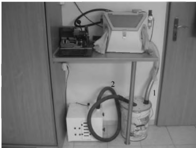
Rys. 9.4 Odciąg miejscowy wraz z separatorem podłączony do piaskarki

Jeden koniec rury wyciągu (1) podłączony jest do piaskarki, a drugi jej koniec podłączony został do separatora pyłów. Druga rura (2) zamocowana jest do separatora (zamiennie z osłoną) i jej drugi koniec do wnętrza skrzynki (obudowy), w której znajduje się filtr standardowy (rys. 9.4).