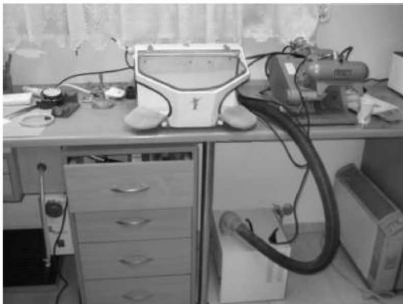
Rys. 9.5 Odciąg miejscowy podłączony do osłony

Dodatkowo sam wyciąg bez separatora można podłączyć do osłony (rys. 9.5, 9.6). Zabezpiecza ona powierzchnię wokół miejsca pracy przed pyłami i odpryskami (szczególnie przydatny przy obróbce modeli gipsowych, protez akrylowych, czy metalu).