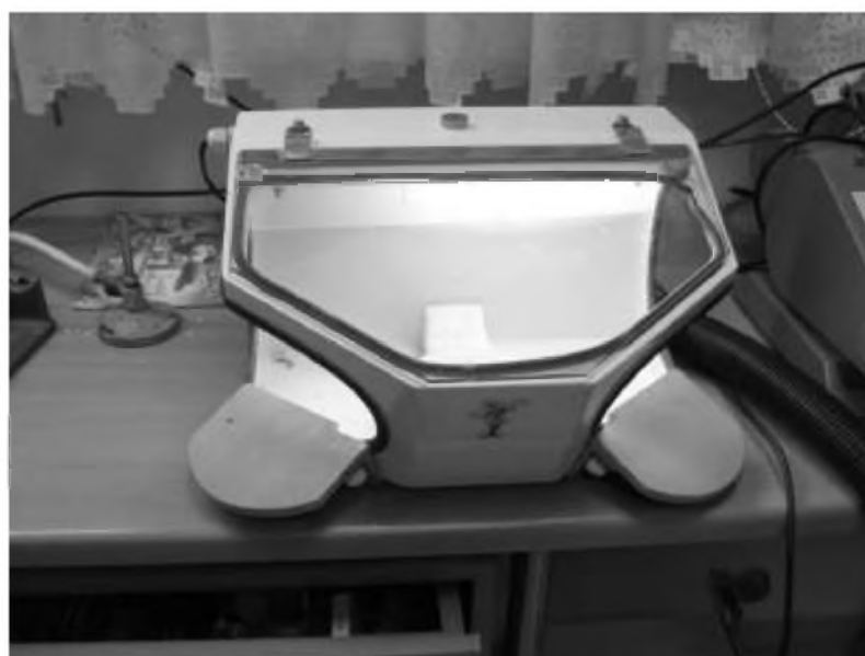
Rys. 9.6 Osłona odciągu