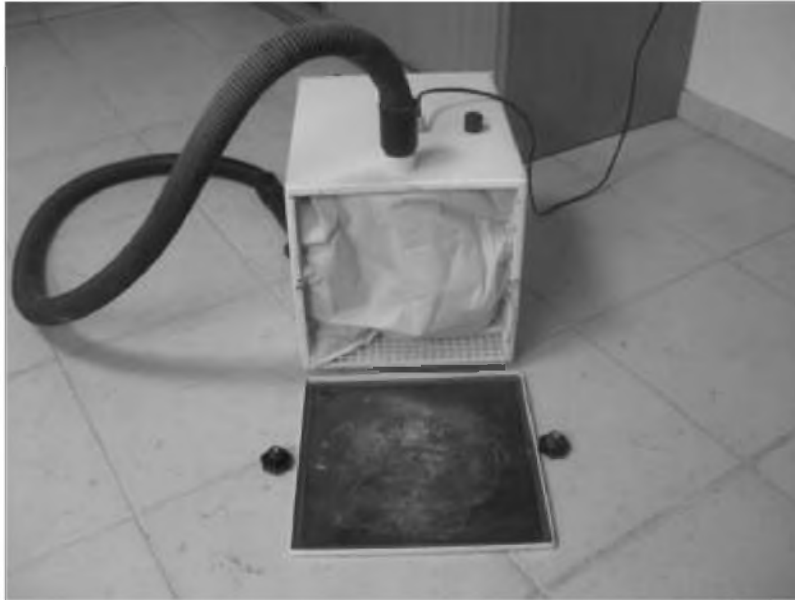
Rys. 9.3 Worek z fizeliny umieszczony wewnątrz obudowy

W obudowie wyciągu została zainstalowana turbina. Znajduje się tam również filtr standardowy i worek z fizeliny (rys. 9.3).