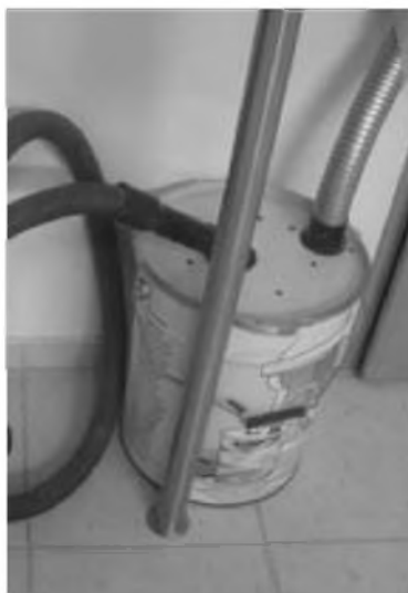
Rys. 9.7 Separator pyłów

separator (zbiornikiem pośrednim przenośnym) używanym do czyszczenia kominków (rys. 9.7).