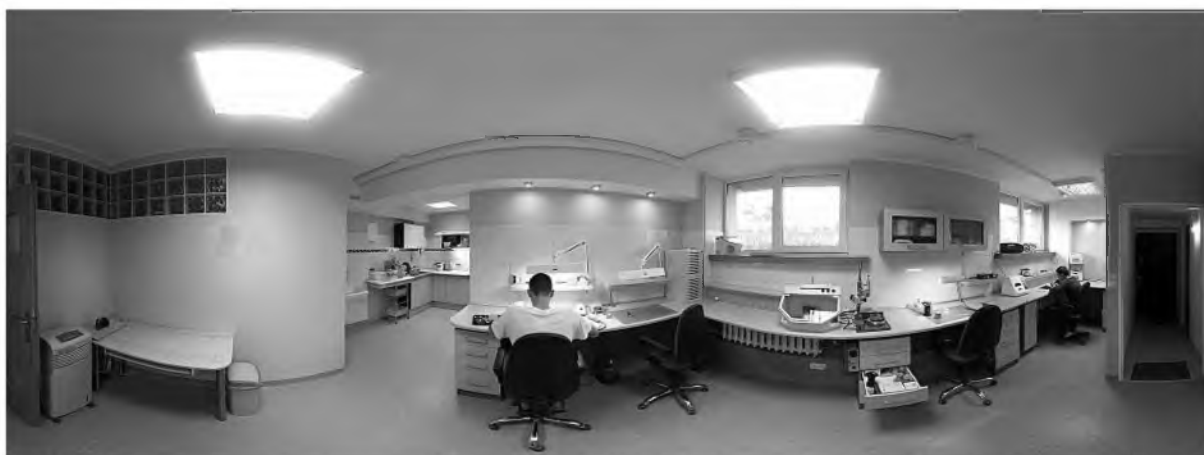
Rys. 9.2 Przykładowa pracownia protetyczna

Pomieszczenia pracowni protetycznej powinny posiadać wentylację grawitacyjno-kanalową, zapewniającą co najmniej półtora-krotną wymianę powietrza na godzinę. Pomieszczenia pracowni protetycznych, w których wydzielają się gazy, pary lub pyły szkodliwe dla zdrowia, poza wentylacją grawitacyjno-kanalową powinny posiadać wentylację mechaniczną, zapewniającą co najmniej taką wymianę powietrza, jaka jest potrzebna do rozrzedzenia gazów, par lub pyłów do wartości obowiązujących dopuszczalnych stężeń [7].