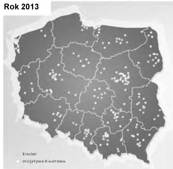
Rys. 15.1 Interaktywna mapa klastrów Polski