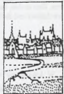
Rys.1. Miasto historyczne Fig.1. Historical town

Krajobraz XIX-wiecznego miasta (rys.2) cechuje