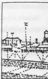
Rys.6. Krajobraz przemysłowy Fig.6. Industrial landscape

Krajobraz tradycyjnej wsi (rys.8) przedstawiał harmonijny widok. Wszystkie podziały wyznaczano zgodnie z „naturą miejsc”, czyli uwzględniając granice fizyczne i geograficzne. Decyzje podejmowano obserwując przebieg linii grzbietowych i ciekowych, krawędzie stoków lub tarasów. Linie graniczne, utrwalone przez wiekowe użytkowanie terenu, akcentowały smugi drzew i krzewów, mury z kamieni gromadzonych na skraju pola. Razem tworzyły one specyficzny rysunek wsi, doskonale wkomponowany w otaczający krajobraz, a właściwie będący jego kontynuacją.