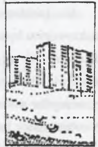
Rys.3. Osiedle wielkoblokowe Fig.3. Multi-building residential settlement

Rozrastająca się zabudowa pochłania wsie, dawne osady, jurydyki podmiejskie, cmentarze.