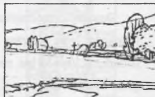
Rys.9. Krajobraz o przeważających walorach przyrodniczych Fig.9. Landscape of prevailing natural quality