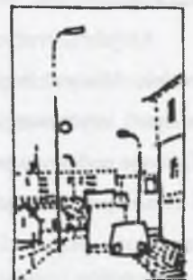
Rys.5. Krajobraz podmiejski Fig.5. Suburban landscape