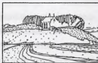
Rys.7. Małe miasteczko Fig.7. Small town