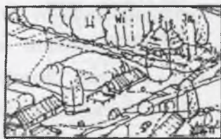
Rys.8. Tradycyjna wieś Fig.8. Traditional village