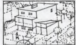
Rys.4. Zabudowa jednorodzinna Fig.4. Detached housing