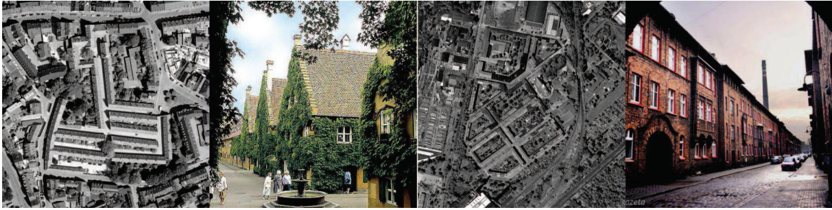
il.1 Osiedle robotnicze: a - Fuggerei w Augsburgu, Niemcy, 1516 - 1526 r. [16]; b - Nikiszowiec w Katowicach, Polska, 1906 - 1910 r. [17].