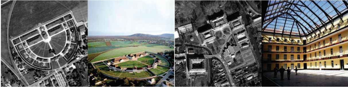
il.2 Idealne miasto społeczne: a - Królewska Salina w Arc-et-Senans, Francja, od 1736 r., [18]; b - Familister w Guise, Francja, 1865 r., [19].