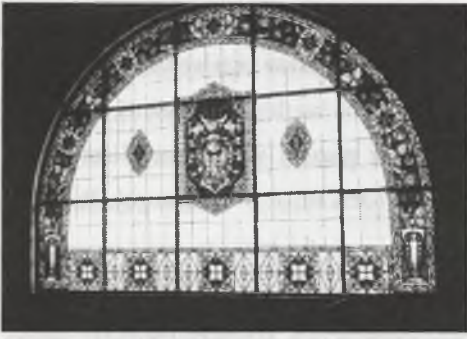
Rys. 3. Okno witrażowe z herbem miasta Oleśnicy

Fig. 3. The stained glass with picture of arms of the town