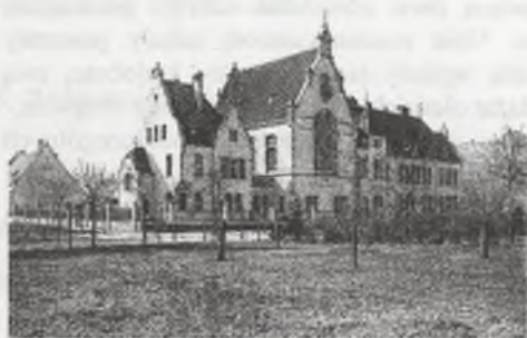
Rys. 1. Gimnazjum męskie

W XIX wieku nastąpił rozwój szkolnictwa elementarnego. 3 W Oleśnicy w końcu XIX wieku wzrosła liczba uczniów. Ewangelicka Szkoła Podstawowa miała coraz bardziej przepełnione klasy. W 1881 roku powstał nowy budynek szkolny, który jednak bardzo szybko okazał się niewystarczający. W związku z zaistniałą sytuacją oraz przewidywaniami, że wraz z rozwojem kolei napłynie do Oleśnicy nowa ludność, podjęto decyzję o budowie nowego gmachu Elementarnej Szkoły dla Chłopców (Volksschule).