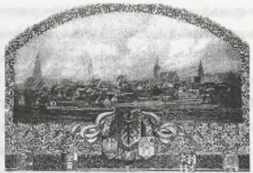
Rys. 4. Malowidło panoramy Oleśnicy

Fig. 4. A Picture of panorama of Oleśnica