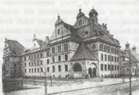
Rys. 2. Szkoła Elementarna dla Chłopców