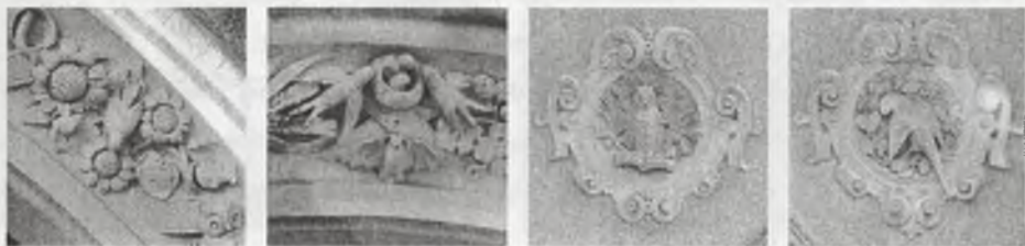
Rys. 5. Detal

symbol mądrości i wiedzy, pośród gałązek sosnowych z szyszkami. Drugi zawiera odwróconą tyłem papugę, która z założenia oznaczać miała czynność. 15