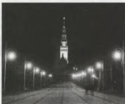
Rys. 2. Klasztor na Jasnej Górze – zamknięcie osi urbanistycznej

Fig. 2. Kłoster in Częstochowa “Jasna Góra” – closure of viewing pivot