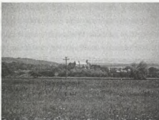
Rys. 1. Klasztor w Bołszowcach – dominanta krajobrazowa

Fig. 1. Mastery in Bołszowce – scenery dominant