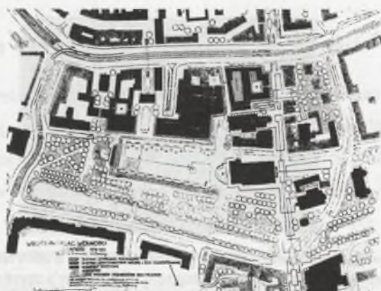
Rys. 2. Rzut Placu Wolności i otoczenia; projekt Władysława Czernego

W 1974 r. temat zagospodarowania placu podjął Władysław Czerny – architekt i urbanista mieszkający we Wrocławiu od 1964 r. Projekt zachował się w postaci szkiców wykonanych na kalce 9 jako studium kompozycyjne placu. Brak jednak opisu projektu, oprócz uwag na szkicach. Idea Czernego koresponduje z dzisiejszą wizją znaczenia placu dla miasta, a w kwestii nadania mu rangi i jednolitego charakteru nawiązuje do założenia z połowy XIX w.