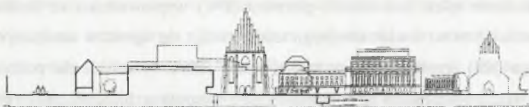
Rys. 3. Przekrój przez Plac Wolności z widokiem na elewację Opery; projekt Czernego Fig. 3. Section of Wolności Square with view on Opera's elevation; Czerny's project

Problem północnej granicy placu rozwiązał Czerny prosto i bezkompromisowo, nadając charakter całej kompozycji. zaproponował ogromną bryłę teatru. Nie podał niemal żadnych szczegółów co do jej architektury, z pewnością jednak jego zamysłem było ukształtowanie północnej elewacji placu w formie ciągu spokojnych zabudowań stanowiących jednocześnie tło mających tu miejsce wydarzeń 11 . Kontrowersje może budzić fakt sanacji pozostałości zachodniego skrzydła pałacu królewskiego, stanowiącego kiedyś długą reprezentacyjną elewację. Stoi on dziś dokładnie na osi wjazdu na plac. Wysunięty jest w stosunku do pozostałych budynków na południe ze względu na dawne wysunięcie pałacu. Nie stanowi już jednak dominanty. Prawdopodobnie więc wydaje się, że Czerny uznał zachowanie resztek pałacu za zbyt kolidujące z prawidłową kompozycją placu.