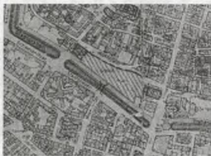
Rys. 1. Plac Zamkowy i jego otoczenie – fragment planu Wrocławia z 1934 roku

Decydującym okresem okazały się lata bezpośrednio po wstąpieniu na tron Fryderyka Wilhelma IV 4 . Za jego sprawą powstało założenie, zwane później „Forum Królewskim” 5 . Plac zyskał nową reprezentacyjną oprawę. Od zachodu flankowały go sąsiadujące ze sobą gmachy teatru i Generalnej Komendantury, od wschodu Sejm Stanów Śląskich, od południa za fosą zespół sądowo-więzienny. Budowlą spinającą całość był pałac królewski. Około 1847 r. Forum Królewskie było już ukształtowane, a jego wymowa czytelna. Po zmianie ustroju politycznego w 1848 r. w okolicy zaczęły pojawiać się budowle mieszczańskie 6 . Powstałe w połowie XIX w. przesłanie placu zaczęło ulegać powolnemu zatarciu.