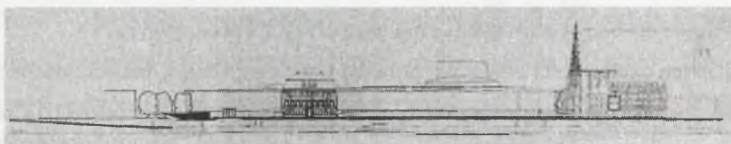
Rys. 4. Przekrój przez Plac Wolności z widokiem w kierunku północnym; projekt Czernego Fig. 4. Section of Wolności Square with view on north; Czerny's project

Problem północnej granicy placu rozwiązał Czerny prosto i bezkompromisowo, nadając charakter całej kompozycji. zaproponował ogromną bryłę teatru. Nie podał niemal żadnych szczegółów co do jej architektury, z pewnością jednak jego zamysłem było ukształtowanie północnej elewacji placu w formie ciągu spokojnych zabudowań stanowiących jednocześnie tło mających tu miejsce wydarzeń 11 . Kontrowersje może budzić fakt sanacji pozostałości zachodniego skrzydła pałacu królewskiego, stanowiącego kiedyś długą reprezentacyjną elewację. Stoi on dziś dokładnie na osi wjazdu na plac. Wysunięty jest w stosunku do pozostałych budynków na południe ze względu na dawne wysunięcie pałacu. Nie stanowi już jednak dominanty. Prawdopodobnie więc wydaje się, że Czerny uznał zachowanie resztek pałacu za zbyt kolidujące z prawidłową kompozycją placu.