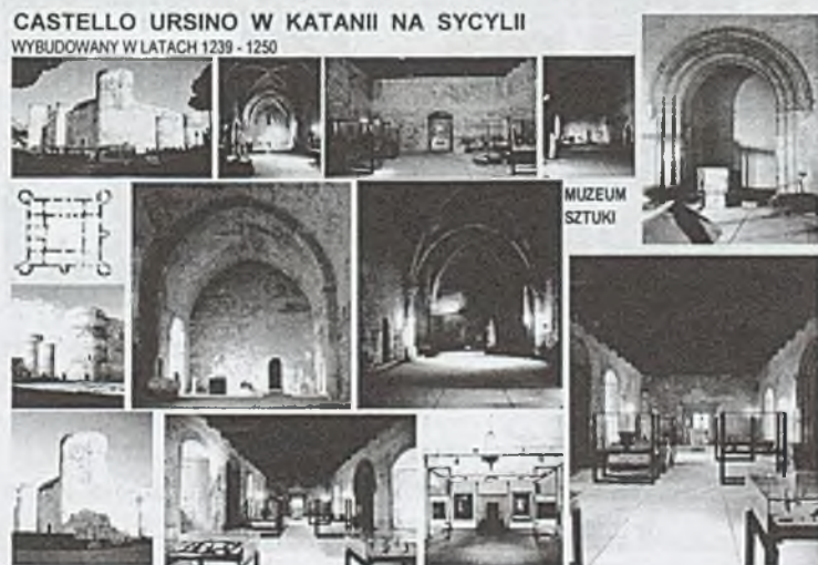
Rys. 2. Fig. 2.