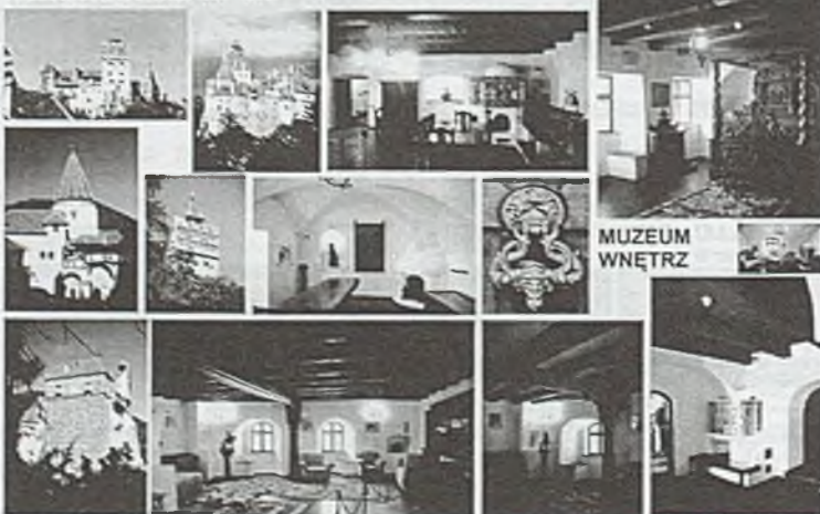
Rys. 4.