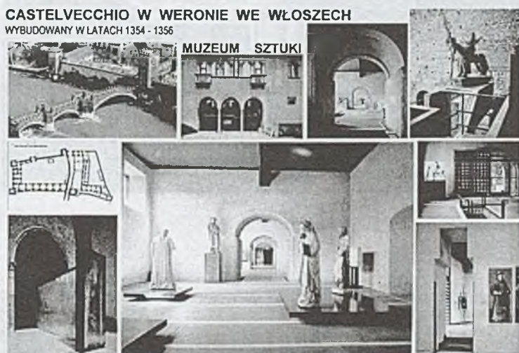
Rys. 1. Fig. 1.

Przekształcenie historycznych zamków i pałaców obronnych w muzea lub galerie nie jest już wyjątkiem, lecz stało się regułą. Prezentacja zabytkowych artefaktów w budynku pochodzącym z tego samego okresu historycznego, w którym powstały prezentowane eksponaty i przedmioty, jest bardzo korzystna ze względów ekspozycyjnych – wnętrza obiektu stają się naturalnym tłem dla wystawianych dzieł.