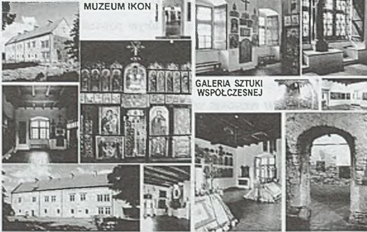
Rys. 3.