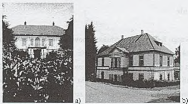
Rys. 5. a) b) Dwór w Toszonowicach Dolnych