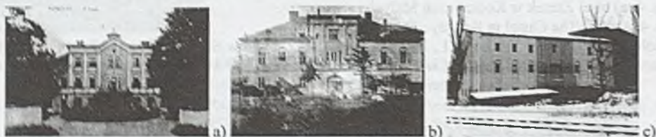
Rys. 6. a) b) c) Pałac w Końskiej na początku XX wieku i w 1995