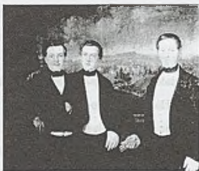
Rys. 1. „Portret rodziny Mattencloit” E. Świerkiewicz 1846 rok. W tle widoczny pałac w Zebrzydowicach.