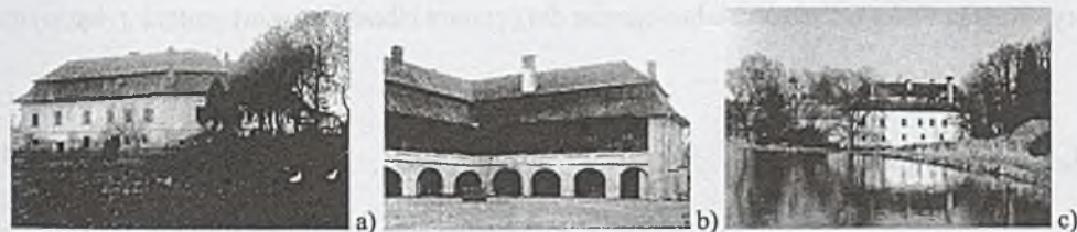
Rys. 4. a) b) c) Zamek w Kończycach Małych