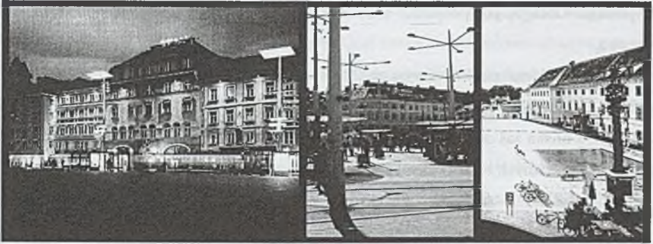
Rys. 2. Hauptplatz, Architektur Graz... , opis A 01; Jakominiplatz, fotografia własna autorki; Karmeliterplatz, 10 Jahre UNESCO Welterbe Graz... , s. 71