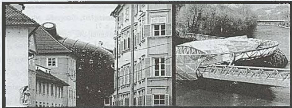
Rys. 3. Muzeum Sztuki Współczesnej Kunsthaus, fotografia własna autorki; Sztuczna wyspa Murinsel, fotografia własna autorki

Drugim obiektem zrealizowanym w 2003 r. była sztuczna wyspa Murinsel (proj. Vito Accondi). Konstrukcja wykonana ze stalowych, trójkątnych modułów z daleka lśni jak wody rzeki Mur, z bliska zaś oczarowuje inżynierską precyzją wykonania. Murinsel stanowi miejsce spotkań teatralnych i muzycznych, a na co dzień służy jako kawiarnia.