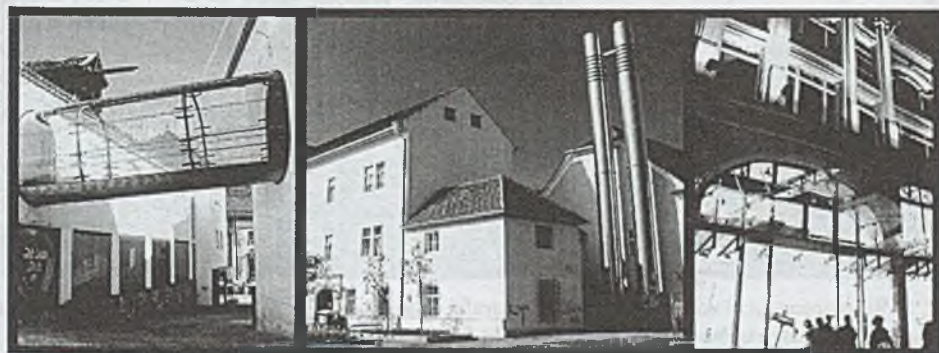
Rys. 4. Muzeum Etnograficzne Joanneum, fotografia własna autorki; Archiwum Regionalne, fotografia własna autorki; Dom handlowy Kastner & Öhler, fotografia własna autorki

Charakter rewitalizacji miała przebudowa Steiermärkische Sparkasse (2006 r., architektki: Michael Szyszkowitz + Karla Kowalski). Ten powstały w latach 70. XX w. budynek wymagał nowego kostiumu architektonicznego. Obłożenie go półprzezroczystymi lamelami nie tylko pozwoliło na modernizację wyglądu bez nadmiernych kosztów, ale pozwoliło także znacznie zredukować zapotrzebowanie energetyczne obiektu.