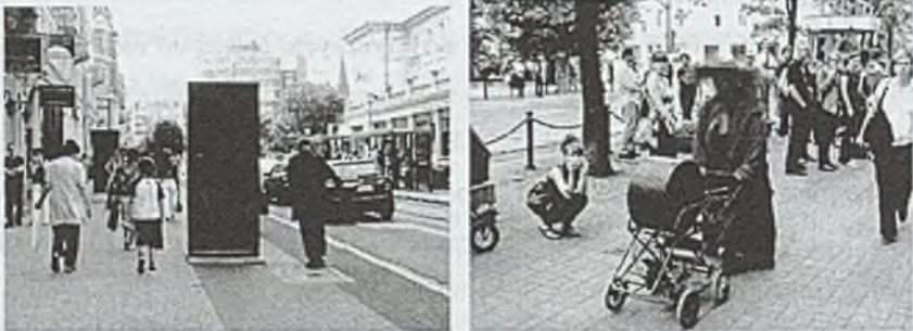
Rys. 3, 4. Akcja uliczna DOMINO, Teatr Strefa Ciszy, ul. 27 Grudnia, czerwiec 2009