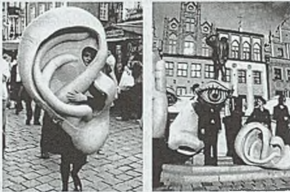
Rys. 1, 2. Zmysły – wędrowny kabaret liryczny, Teatr A3, Jarmark Świętojański, Stary Rynek, czerwiec 2009

mosty, Most Jordana na Ostrowie Tumskim służy jako miejsce przedstawień, np. podczas Festiwalu Malta, organizowane są tu także działania teatralno-muzyczne, promujące twórczość wielkich kompozytorów; w latach 2009 i 2010 odbyły się kolejno dwa wydarzenia pod hasłami: „Haendel na Śródcie” i „Chopin na Śródcie”.