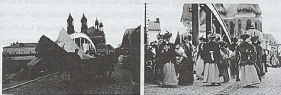
Rys. 7, 8. Chopin na Śródce , Most Jordana, kwiecień 2010