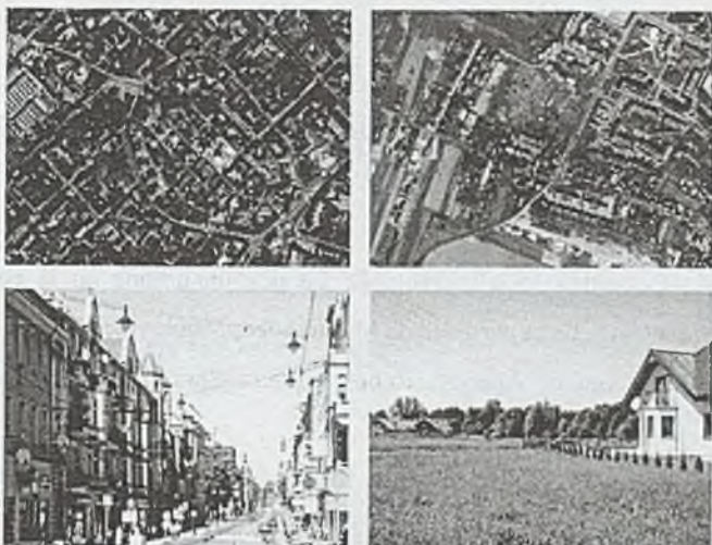
Fot. 2. Kontrast między centrum miasta a strefą podmiejską na przykładzie Gliwic, Google Earth, fot: B. Turyk

Photo 2. The contrast between the city and suburban zone, based on the example of the Gliwice city, Google Earth, fot: B. Turyk