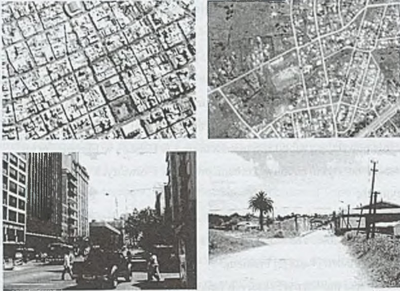
Fot. 1. Kontrast między centrum miasta a strefą podmiejską na przykładzie Montevideo, Google Earth, fot. B. Turyk

Photo. 1. The contrast between the city and suburban zone, based on the example of the Montevideo city, Google Earth, photo: B. Turyk