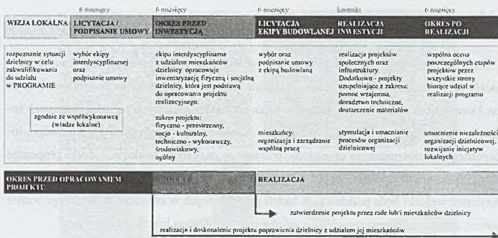
Rys. 2. Schemat procesu integracji dzielnicy, opracowanie własne na podstawie PIAI 1, Ańo 1, 2006 Fig. 2. A diagram of district integration process, based on PIAI 1, Ańo 1, 2006