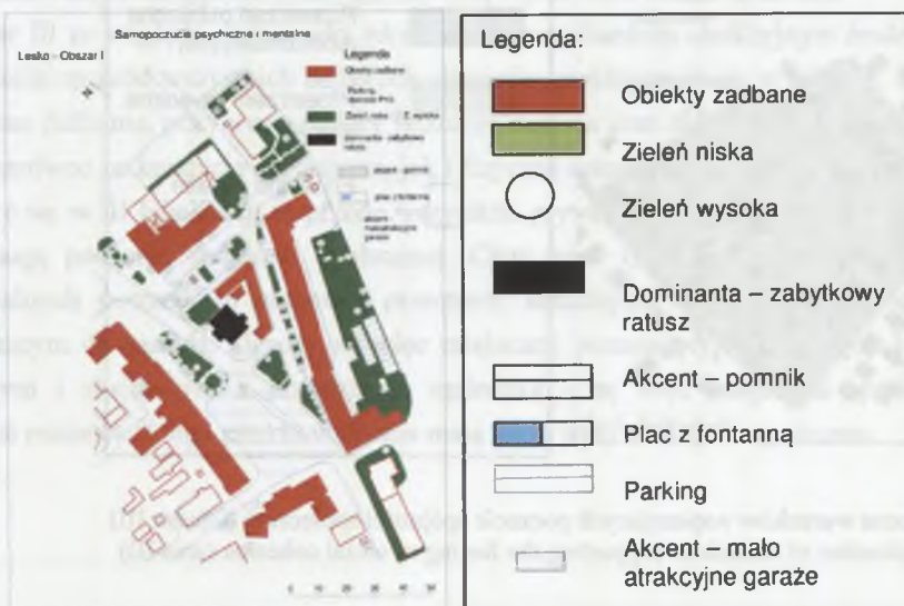
Rys. 1. Ocena warunków wspierających samopoczucie psychiczne i mentalne (Obszar I) Fig. 1. Evaluation of conditions supporting a good frame of mind (area I)