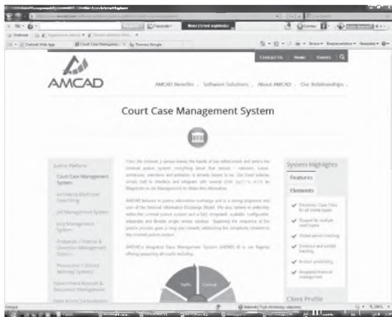
Rys. 2. Printscreen strony oferującej oprogramowanie w zakresie CMS