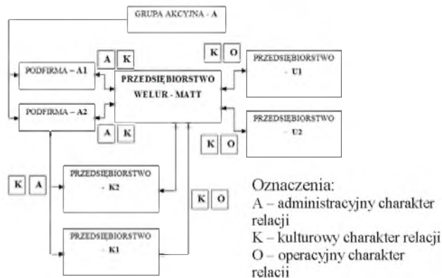
Rys. 5. Charakter relacji występujących pomiędzy przedsiębiorstwami sieci

ter operacyjny pozwala partnerom na większą niezależność od sieci niż w przypadku relacji administracyjnych.