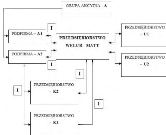
Rys. 3. Przepływ informacji w strukturze sieciowej z udziałem Welur-Matt