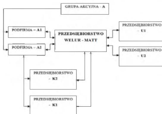
Rys. 1. Schemat funkcjonowania przedsiębiorstw sieciowych z udziałem WELUR-MATT