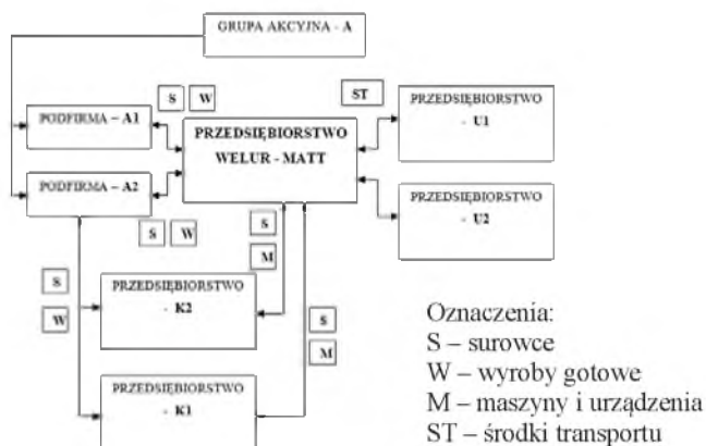
Rys. 2. Przepływ zasobów materialnych w strukturze sieciowej z udziałem Welur-Matt

Na rysunku 2 widać przepływy surowców i wyrobów gotowych występujące pomiędzy przedsiębiorstwem zagranicznym – zleceniodawcą – a polskimi przedsiębiorstwami produkcyjnymi, do których należy Welur-Matt i dwa podmioty konkurencyjne. Fakt ten oznacza, że przedsiębiorstwa produkcyjne są zaopatrywane w surowce bezpośrednio przez zleceniodawcę. Daje to możliwość wyspecjalizowania się w swojej działalności dla każdej ze stron. Z kolei wyroby gotowe wysyłane są do centrów dystrybucyjnych zleceniodawcy, który zajmuje się ich sprzedażą. Omawiając podmioty usługowo-produkcyjne, można zauważyć, że także pomiędzy nimi odbywają się przepływy materiałowe. Przemieszczone są surowce, gdy w którymś z przedsiębiorstw występują braki magazynowe. System ten pozwala na zaoszczędzenie czasu, ponieważ nie ma potrzeby nagłego sprowadzania surowca od zleceniodawcy, a wystarczy „pożyczyć” surowiec od zaprzyjaźnionego konkurenta. Tak jak surowce, przemieszczane są tu również maszyny. W zależności od potrzeb produkcyjnych przedsiębiorstwa wymieniają się maszynami i urządzeniami produkcyjnymi. Fakt ten pozwala na uelastyczenie procesu produkcyjnego. Ostatnim z przepływów materiałowych jest wymiana środków transportu wewnętrznego. Współpraca tego rodzaju jest korzystna w przypadku prac magazynowych, a zwłaszcza wtedy, gdy posiadane środki transportowe ulegają awarii. Wtedy bez problemu urządzenia są pożyczane od partnera sieciowego.