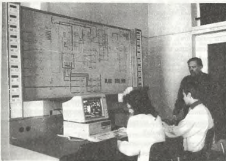
W laboratorium Instytutu Elektroenergetyki i Sterowania Układów: powyżej: w Zakładzie Elektrowni i Gospodarki Elektroenergetycznej, poniżej: w Zakładzie Eksploatacji i Automatykacji Systemów Elektroenergetycznych