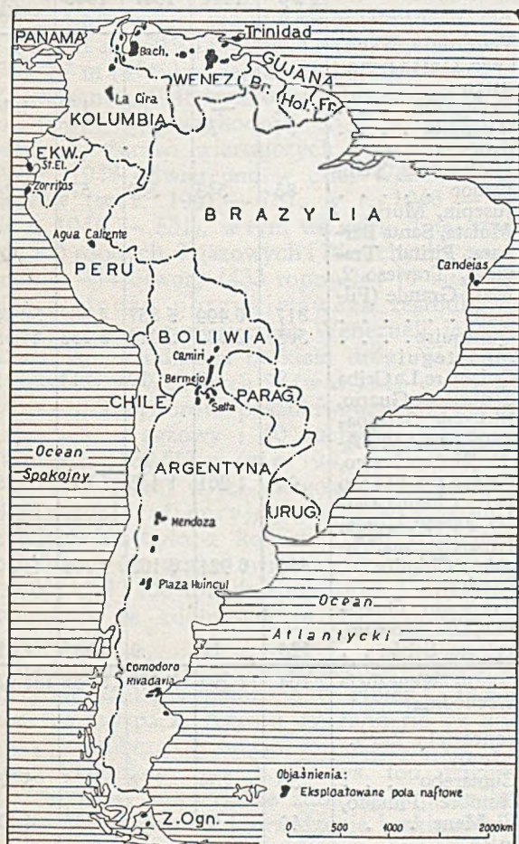
Rys. 11. Mapa eksplloatowanych obszarów naftowych w Ameryce Południowej

W r. 1947 wzmożyła się znacznie działalność poszukiwawcza w południowej części wyspy zwłaszcza na obszarze morskim między Trinidadem a Wenezuelą (zatoka Paria) (rys. 11). Oprócz badań geofizycznych wiercono otwory poszukiwawcze