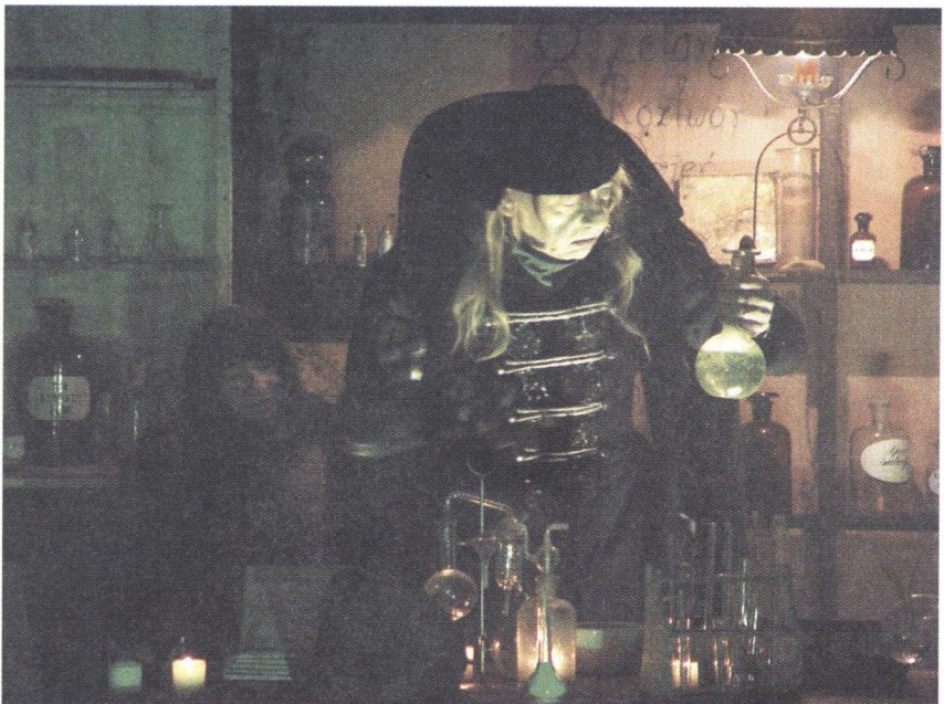
Fot. 3. Laboratorium Alchemika Photo 3. The alchemist laboratory