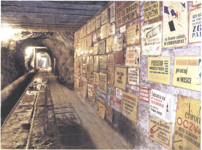
Fot. 2. Muzeum Przestróg, Uwag i Apeli Photo 2. Museum of Warnings, Remarks and Calls