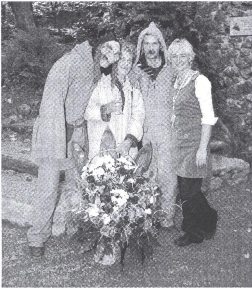
Fot. 4. Stutysięczny turysta Photo 4. The 100 000 th tourist