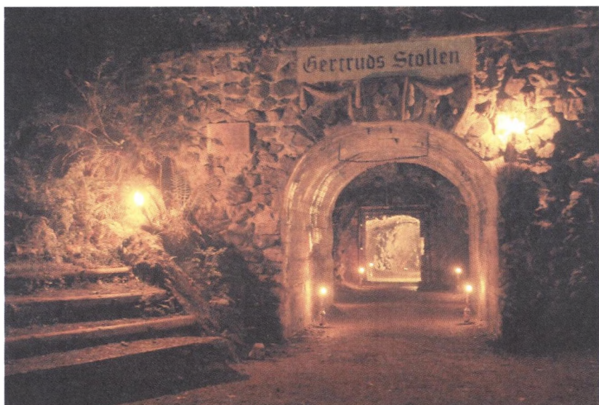
Fot. 1. Sztolnia Gertruda Photo. 1. The Gertruda adit

Wszystkie te czynniki powodują, że chętnie wraca się do tego miasta i do tego niezwykłego miejsca w oczekiwaniu na kolejny „przebój sezonu”.