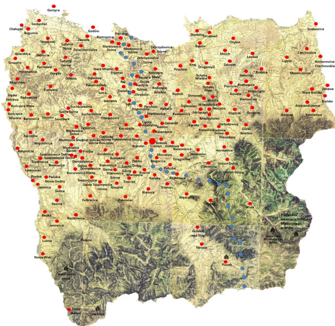
Rys. Mapa fizyczna z naniesionymi lokalizacjami

Posiadłości te rozlokowane są niejednorodnie, oddając tym samym geograficzny układ terenów Księstwa Cieszyńskiego. Stąd też, na rys. 2 przedstawiono położenie zidentyfikowanych lokalizacji posiadłości szlacheckich na mapie fizycznej Księstwa. Rozkład ten wyraźnie pokazuje brak tego typu posiadłości w obszarze górskim, poza rezydencjami myśliwskimi. Od XVI wieku posiadacze ziemscy zaczęli rezygnować z ziem niskiej jakości wynajmując je wolnym kmieciom lub chłopom a następnie sprzedając je. Stąd też w obszarach bagiennych na północy księstwa i obszarach podgórskich nie lokowano w czasach nowożytnych siedzib szlacheckich.