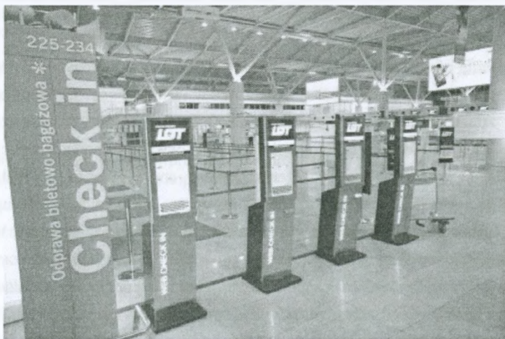
Rys. 3. Automaty Web check-in

Kioski Web check-in to jedno z dodatkowych udogodnień dla tych, którzy nie odprawili się w domu przez Internet.