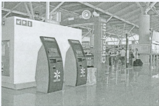
Rys. 2. Stanowiska self check-in

Na lotnisku znajduje się 17 stanowisk odpraw w terminalu A oraz 18 stanowisk odpraw w terminalu B. Po wprowadzeniu 2 stanowisk w terminalu A oraz 2 stanowisk w terminalu B czas odpraw byłby krótszy. W terminalach A i B należałoby 2 stanowiska odpraw check-in zamienić na odprawy self check-in. Obecnie na lotnisku jest możliwość wprowadzenia takiej zmiany dzięki dużej liczbie stanowisk.