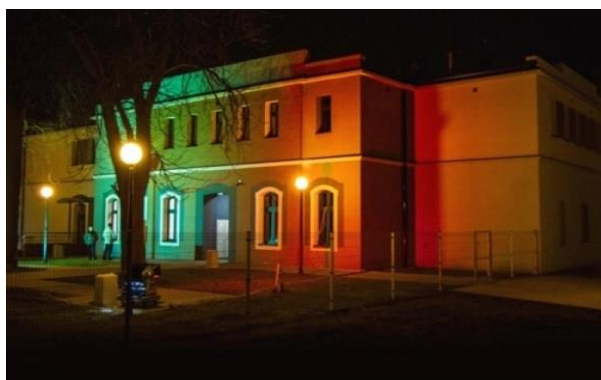
Rys. 2. Zrewitalizowany budynek byłej cechowni kopalni Rozbark obecna siedziba Teatru Tańca i Ruchu Rozbark

Jak wyglądała zatem realizacja tego zapisu w praktyce? Działalność ŚTT w Bytomiu pozostawiła po sobie ślad w postaci powołanego w marcu 2014 roku Bytomskiego Teatru Tańca i Ruchu Rozbark, zlokalizowanego w dawnej zrewitalizowanej cechowni kopalni Rozbark (budynek zaprezentowany na rysunku 2), który kontynuuje tradycje organizowania Międzynarodowej Konferencji Tańca Współczesnego i Festiwalu Sztuki Tanecznej.