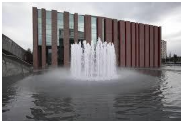
Rys. 1. Nowoczesny budynek Narodowej Orkiestry Symfonicznej Polskiego Radia w Katowicach Fig. 1. Modern building of the National Polish Radio Symphony Orchestra in Katowice

Tytuł Miasta Muzyki jest dla Katowic ukoronowaniem procesu przemiany z miasta poprzemysłowego w miasto przemysłów kreatywnych.