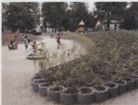
Rys. 4. Ul. Zielińskiego Fig. 4. Zielinski Str.