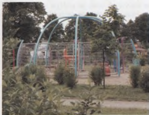
Rys. 6. Siłownia plenerowa, fot. M. Chybalska Fig. 6. Outdoor gym