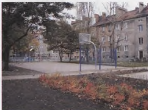
Rys. 5. Boisko wielofunkcyjne, fot. M. Chybalska Fig. 5. Multifunctional court