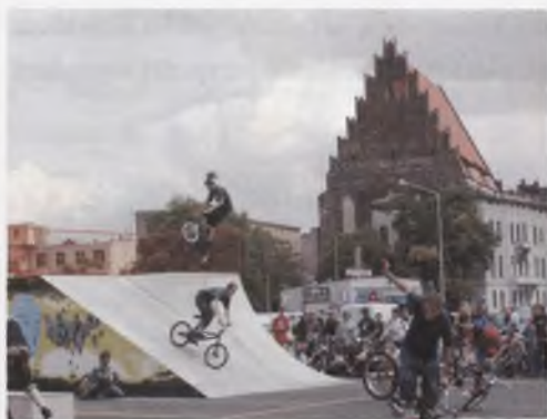
Rys. 8. Skatepark na pl. Wolności Fig. 8. Skatepark at Wolności Square