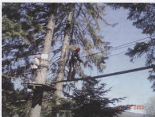
Rys. 9. Park Przygody, Breitenbach, Francja Fig. 9. Adventure Park, Breitenbach