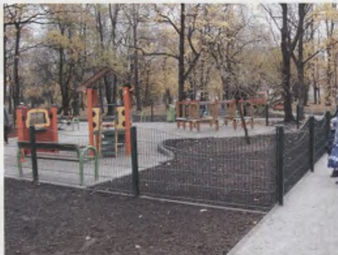
Rys. 2. Park Andersa [fot. M. Chybalska] Fig. 2. Anders'es Park [fot. M. Chybalska]

W trakcie realizacji Programu powstało wiele kompleksowych rozwiązań. Place zabaw w Parku Andersa jest przykładem placu dla dzieci młodszych. Place z piaskownicami zawsze ogrodzono niskim ogrodzeniem zabezpieczającym przed zanieczyszczeniem przez psy. Dobrano urządzenia przeznaczone dla dzieci młodszych, również do zabaw ruchowych (rys. 2.).