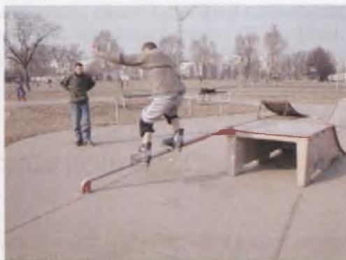
Rys. 7. Miniskatepark, fot. D. Żelaźniewicz Fig. 7. Miniskatepark