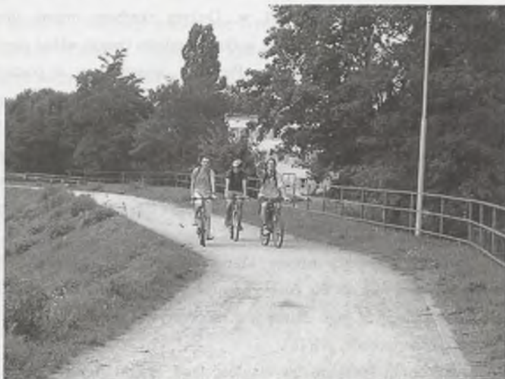
Rys. 3. Trasy rowerowe na wałach nadodrzańskich we Wrocławiu Fig. 3. Bike routes on the Odra-side in Wrocław

Rowery, nowe trendy w stosunku do rzeki. Od początku lat 90. zaobserwować można gwałtowny rozwój turystyki i rekreacji rowerowej w Polsce. We Wrocławiu również systematycznie wzrasta liczba osób uprawiających ten rodzaj rekreacji. Coraz większą popularnością cieszą się też rodzinne wycieczki rowerowe. W ślad za tym podążają, choć zdecydowanie wolniej, konkretne działania przestrzenne. Budowane są nowe drogi rowerowe, udostępniane są dla rowerzystów tereny zielone, wcześniej zarezerwowane tylko dla pieszych, takie jak, np. parki czy nadrzeczne wały przeciwpowodziowe (rys. 3). Dostrzeżono również potrzebę połączenia promenad nadodrzańskich, poprzerywanych w wielu miejscach węzłami i arteriami komunikacyjnymi, choć realizacja tego zamierzenia jest ciągle kwestią przyszłości. Powstały plany budowy przystani jachtowych i strategię rozwoju ruchu turystycznego na Odrze.