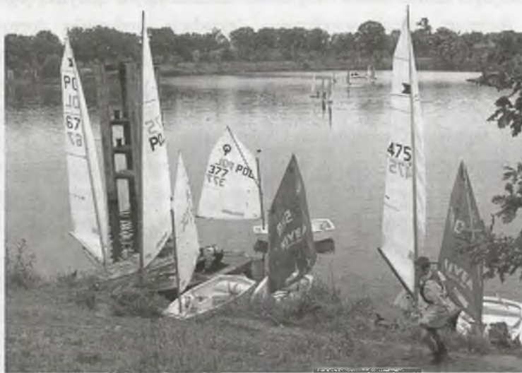
Rys. 2. Nieprzystosowane do celów rekreacji wodnej nabrzeża zimowiska barek Osobowice II we Wrocławiu, akwenu wykorzystywanego do prowadzenia szkoleń i organizowania imprez żeglarskich

Fig. 2. Embankment moorage of barges Osobowice II, Wrocław, unadapted to water recreation. Water area used to hold a courses and to organize nautical events