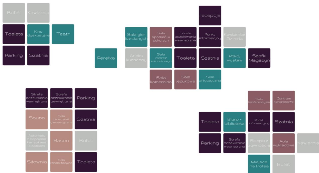
Rys. 2. Schematy blokowe użytkowo-funkcjonalne

Ostatnią częścią warsztatów było programowanie funkcji pomieszczeń administracyjnych i przeznaczonych do oczekiwania. Utworzono schematy blokowe z zapisanych kartek typu Post-it oraz wcześniej przygotowanych kartek z obrazkami i podpisami elementów wyposażenia. Studenci na tej podstawie stworzyli minimalistyczne wizualizacje fragmentów wewnątrz (rys. 3).