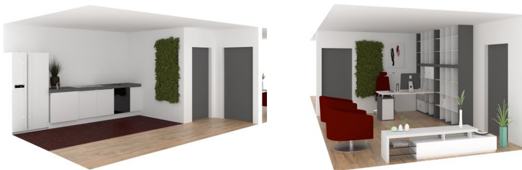
Rys. 3. Wizualizacje fragmentów pomieszczeń